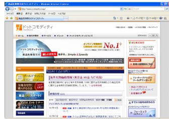
ドットコモディティ ホームページ